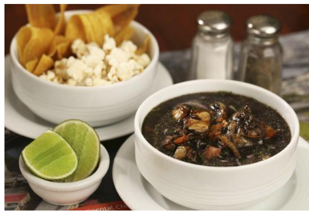
Figura 3 Ceviche de concha prieta en restaurante de alta gama ecuatoriano.

En los restaurantes y cevicherías la A. tuberculosa se limpia, el producto y se abre la concha para posteriormente venderla “viva” (cruda en una de las valvas) o procesada en cócteles y ceviches (Figura 3) a los consumidores finales. El mayor porcentaje de los ingresos que genera la cadena de producción de la concha prieta queda en manos de los acopiadores y de algunos expendedores finales (restaurantes).