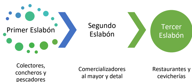
Figura 2 Cadena de Producción del Molusco Bivalvo Concha Prieta Anadara Tuberculosa