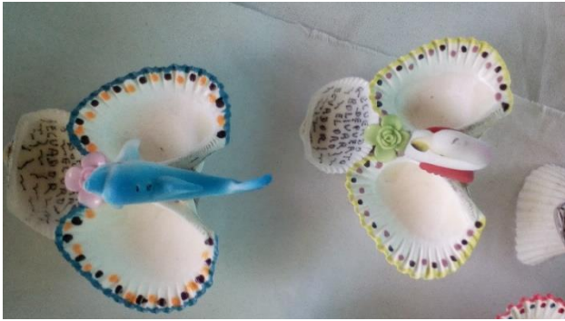
Figura 4. Artesanías realizadas con las valvas de la A. Tuberculosa